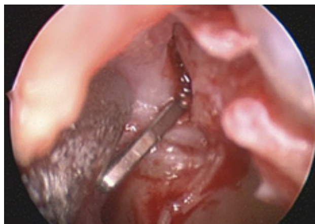
Figura 2: Clipaje endoscópico de la arteria esfenopalatina izquierda.

la parte anterior del tabique o de la zona de los cornetes y cubrirlo con un injerto del tabique o de la pared externa nasal. Es una técnica poco usada y agresiva que consigue un control bueno a medio plazo siempre y cuando los sangrados procedan de la zona anterior.