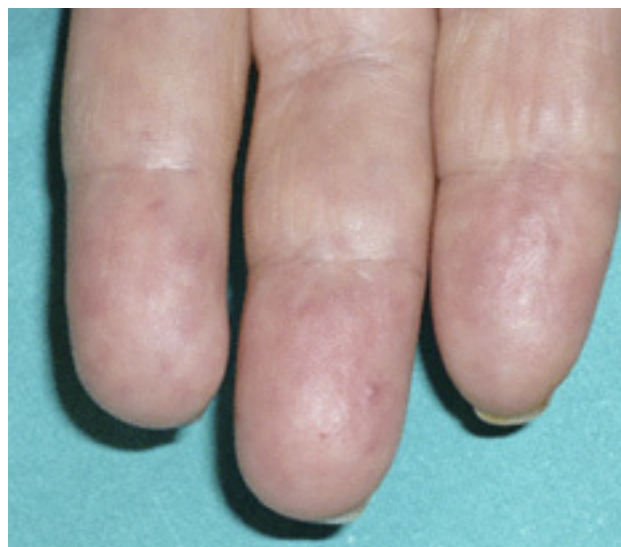
Figuras 1A y 1B: Telangiectasias en zona malar y en pulpejo de los dedos.