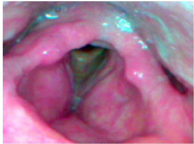
Figura 2: Nasofibroscopia de revisión a los tres meses de finalización del tratamiento, sin signos de recidiva.

El tratamiento médico para la leishmaniasis mucosa consiste en la administración de compuestos antimoniales pentavalentes, como el antimonio de meglumina (Glucantime®) o el estibogluconato sódico (Pentostam®), obteniendo un resultado satisfactorio en la mayoría de los casos. Otros tratamientos alternativos utilizados con éxito son la Amfotericina liposomal B 6 o Amfotericina B gamma-interferón 8 . El tratamiento con cirugía también ha sido descrito como una opción válida asociada al tratamiento médico en las formas más resistentes 9 .