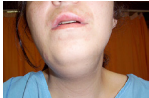
Figura 1: Tumefacción submentoniana y submaxilar bilateral.

Se instaura tratamiento con clindamicina, gentamicina, metronidazol y tratamiento corticoideo, siendo necesario el drenaje y desbridamiento del absceso que presentaba la paciente. Con dicho tratamiento la paciente evoluciona